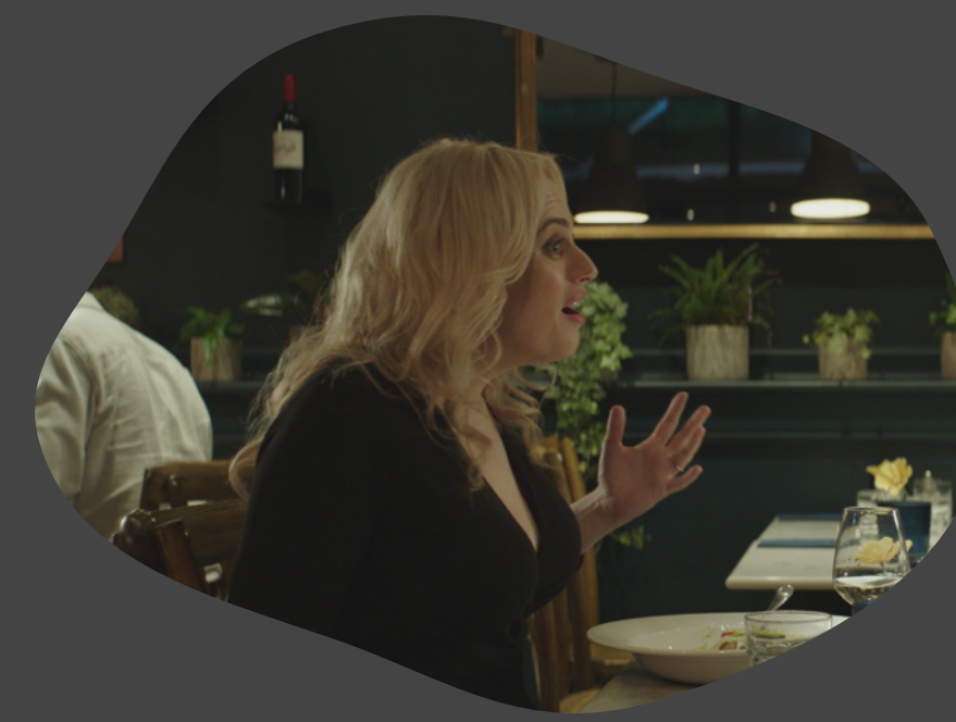
The Almond and the Seahorse