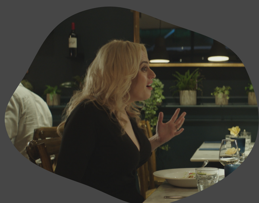
The Almond and the Seahorse