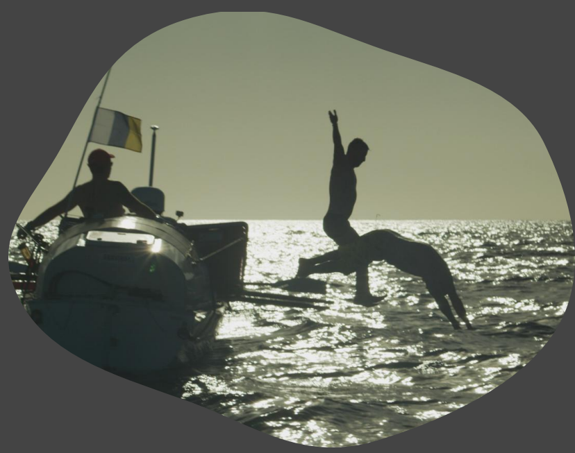
The Road of Excess