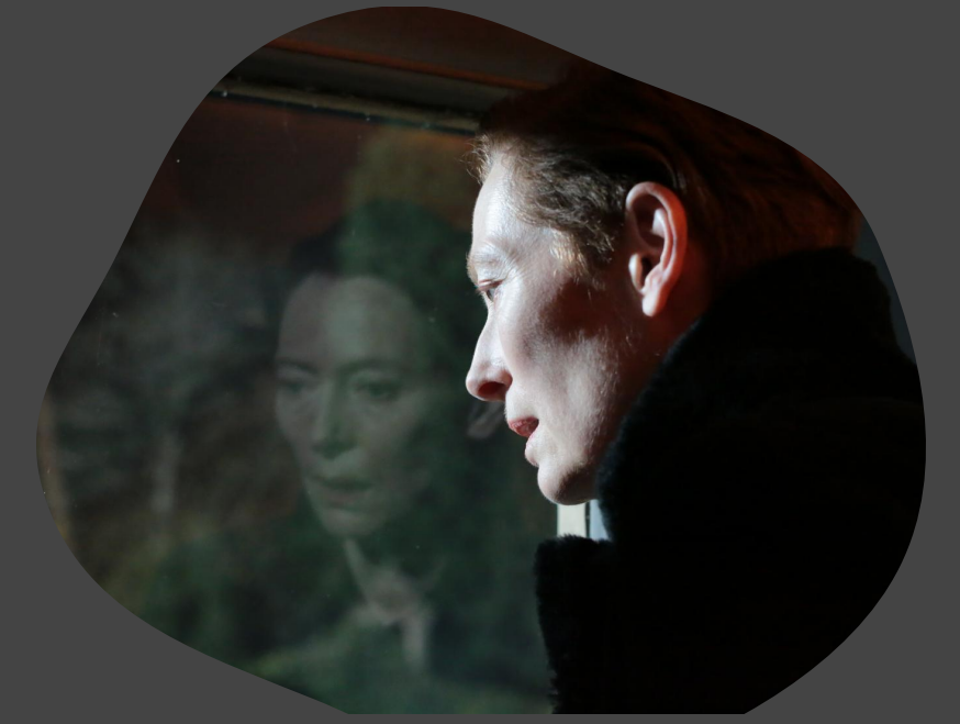
The Eternal Daughter