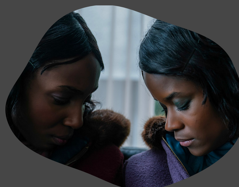
The Silent Twins