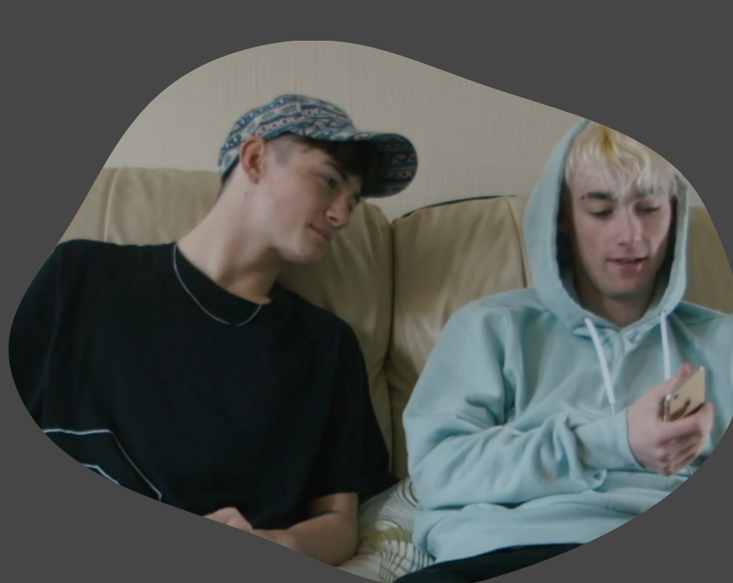
Off the Rails