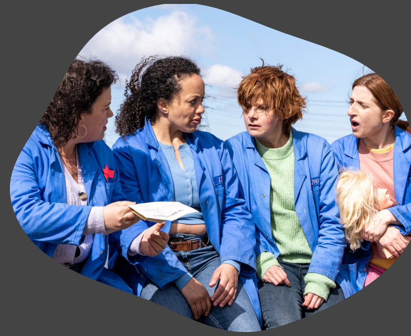
Chuck Chuck Baby