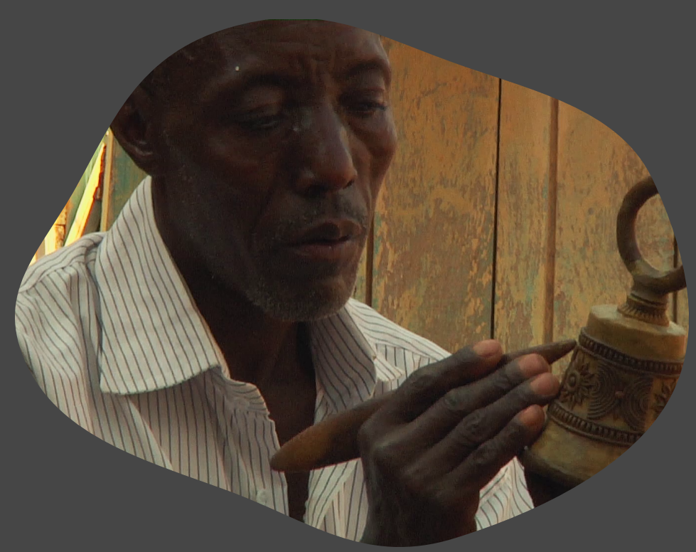
The Bronze Men of Cameroon