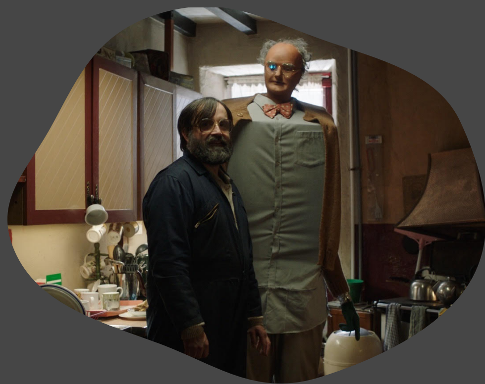
Brian and Charles