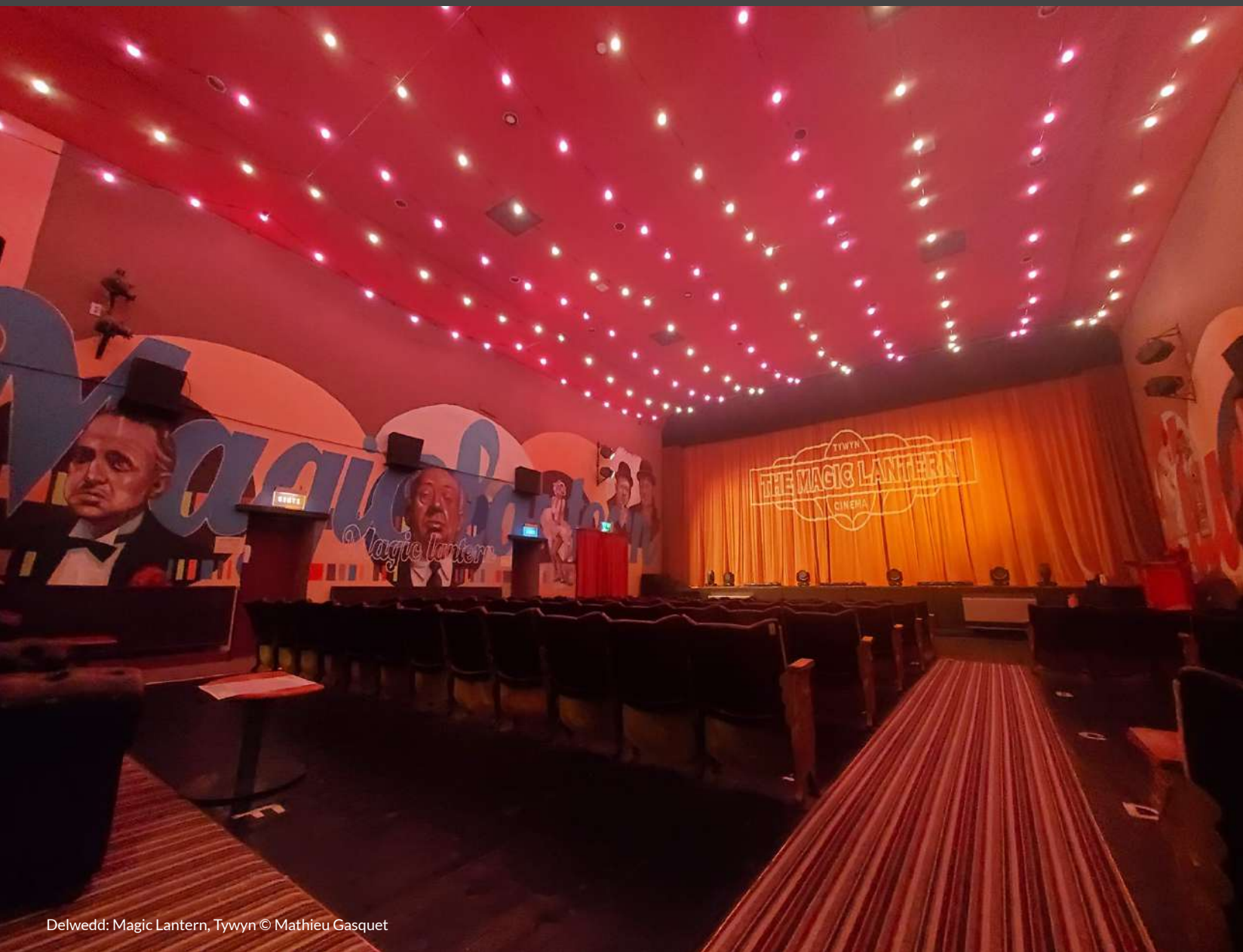
Delwedd: Magic Lantern, Tywyn

Cefnogi cyrff sydd yn cyflwyn ffilmiau Prydeinig, annibynnol a rhyngwladol i gynulleidfaedd ar draws Cymru a'r DU